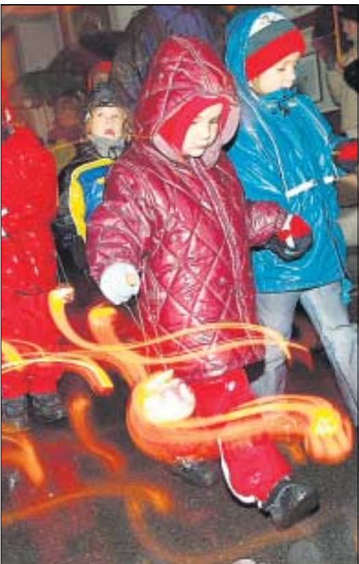
Kinder tragen ihre selbstgeschnitzten Räben durch die Gassen in Richterswil.

In diesen stillen Minuten endet eine Woche, in der sich in Richterswil alles um eine nicht gerade als Köstlichkeit geltende Ackerfrucht gedreht hat. In gegen 30 Schulklassen, in einem Dutzend Vereinen, in Hunderten von Familien werden die rund 50 000 aus dem Zürcher Unterland gelieferten Räben ausgehöhlt, verziert oder mit viel schöpferischem und handwerklichem Geschick zu mäch-