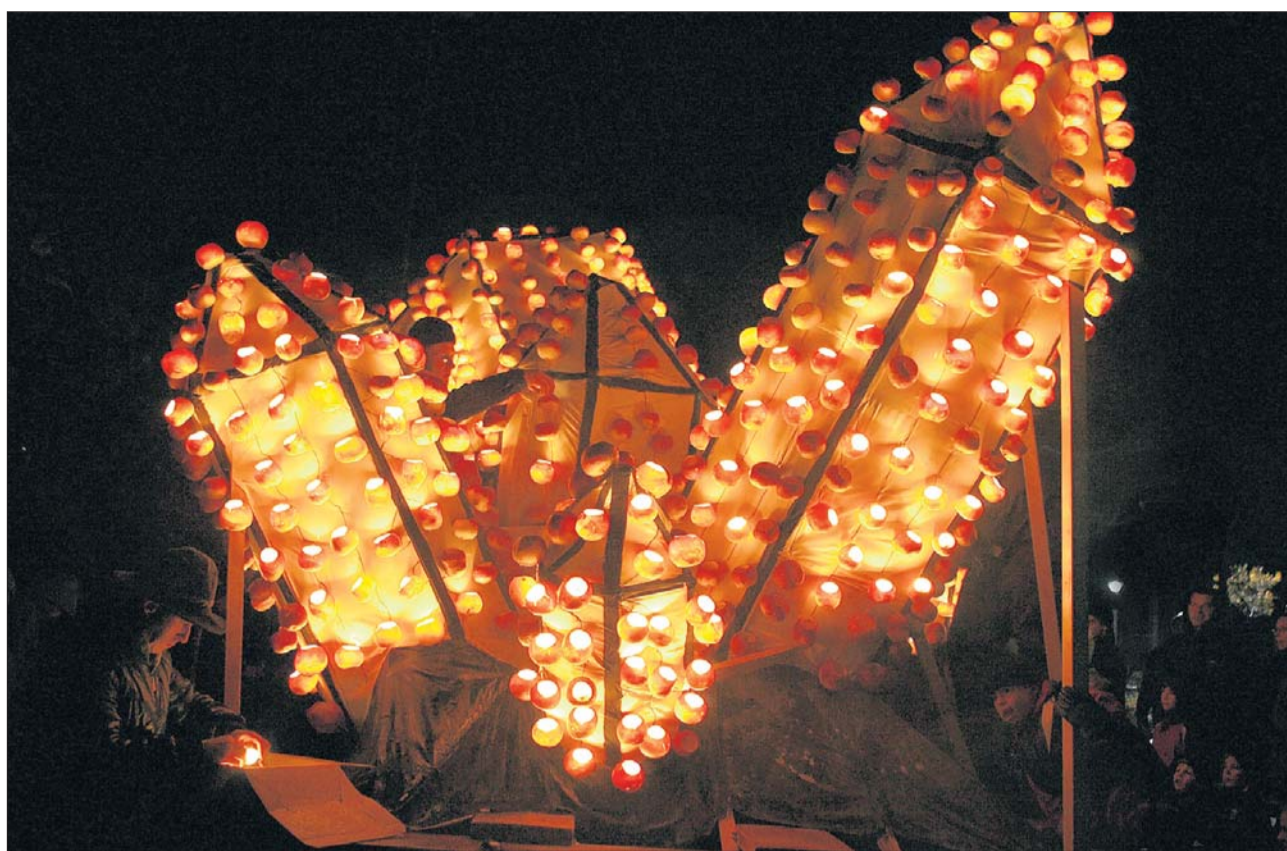
Der Turnverein Richterswil zieht mit dem Jahrhundertfund am Planggenstock durchs Dorf. (André Springer)