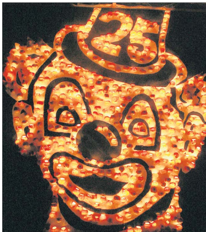
«Zirkus Cevini», vom Cevi Richterswil-Samstagern.