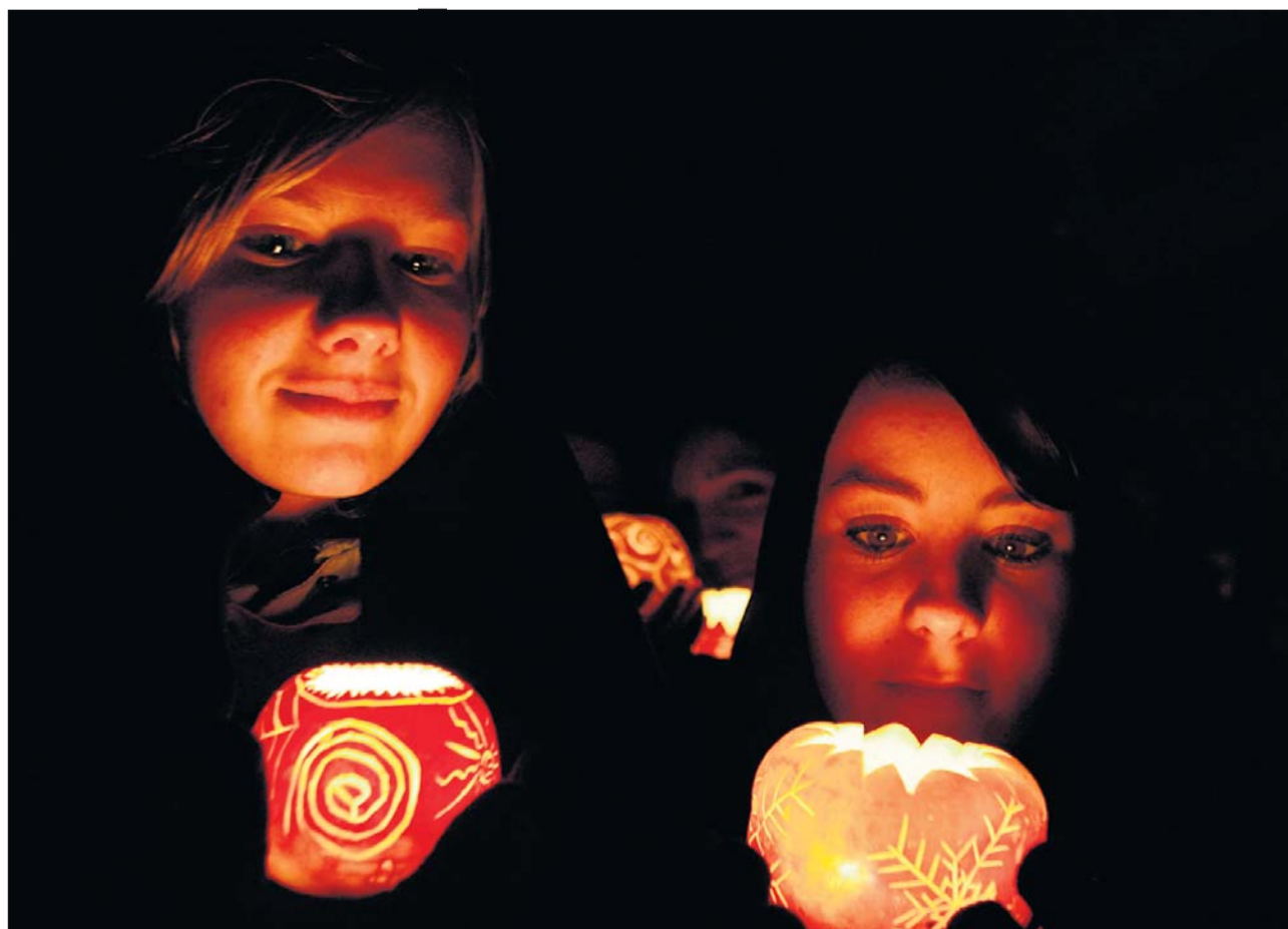
Erhellen die dunkle Nacht und führen den Umzug an: die Kirchgängerinnen (3. Sek.).