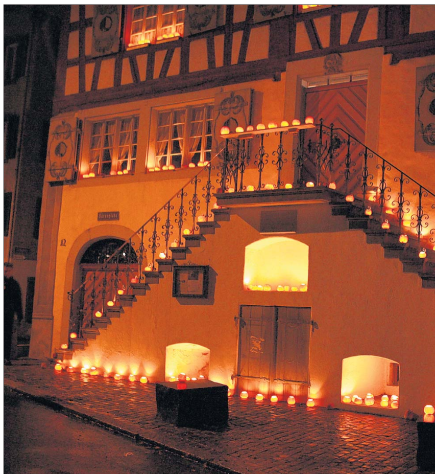
Wie immer wundervoll geschmückt: der «Bären».